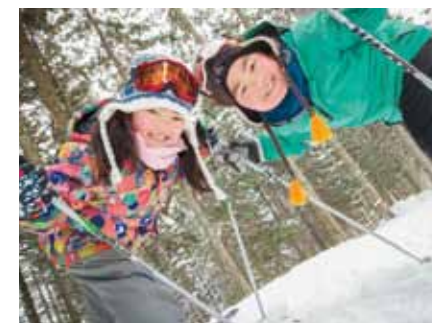
※以上皆以2013年2月末的資料為基準。