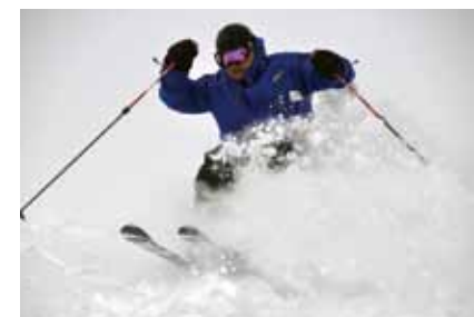
※以上皆以2013年2月末的資料為基準。