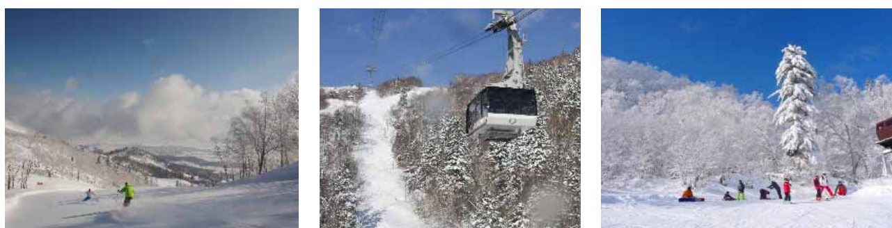
※以上皆以2013年2月末的資料為基準。